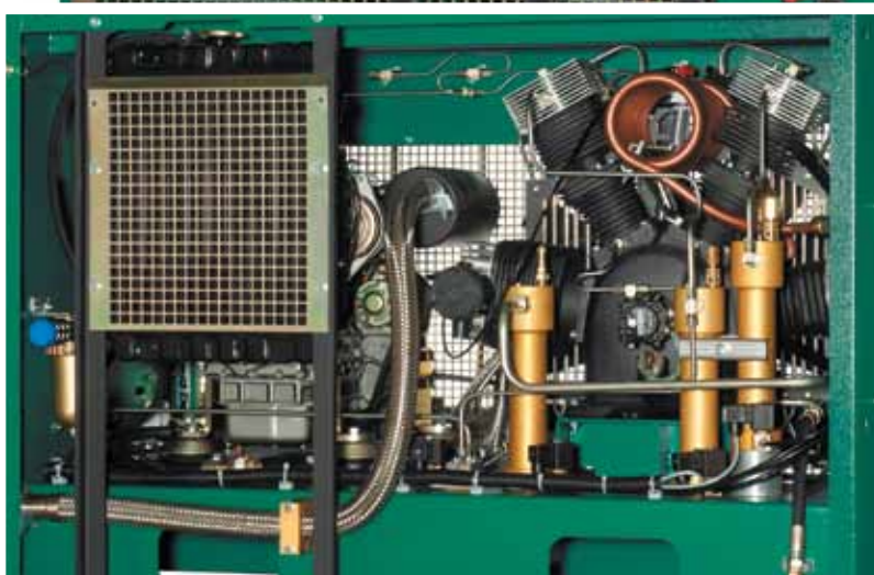
LW 570 D Rückansicht